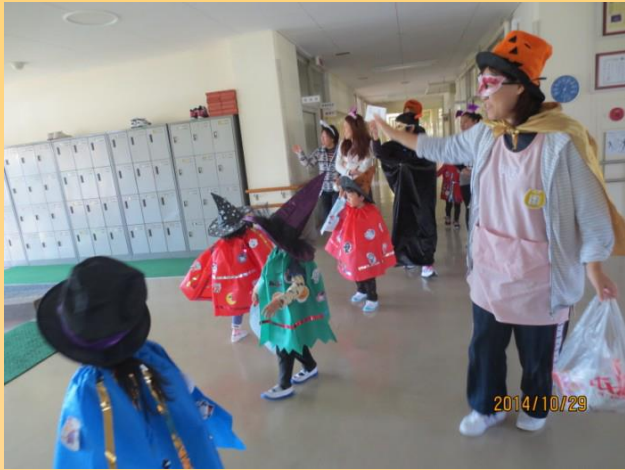
ハロウィンでのコマ